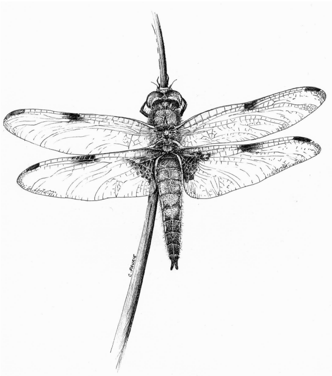
dessin : Carhy Faurie

La SLO va bien évidemment participer à ces rencontres notamment en tenant un stand de présentation des activités de l'association et des publications naturalistes régionales. Et puis, nous mettrons un point d'honneur à animer ces rencontres comme à notre habitude avec en plus cette année des séances de dédicaces de l'ouvrage de Guillaume (là, on en fait peut-être un peu trop !!!)