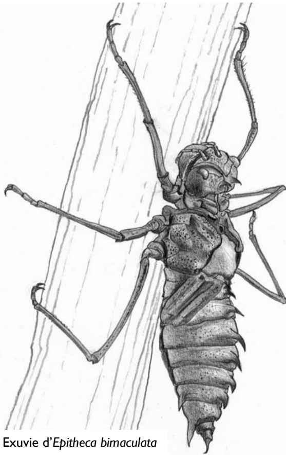
Exuvie d' Epitheca bimaculata